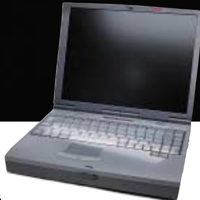
Digital HiNote VP 700.