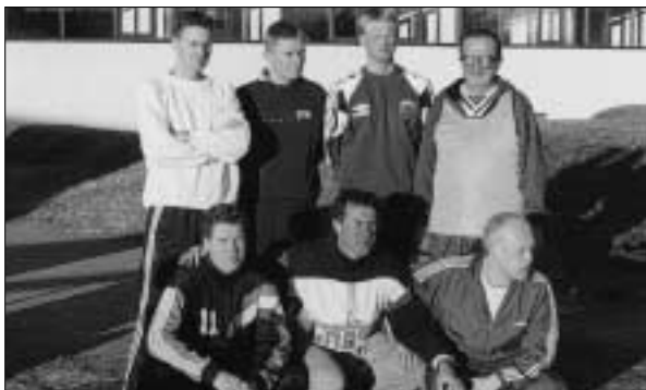
Reynsla og Léttleiki.