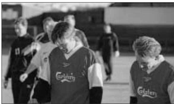
Ekki gengu menn ætíð upplítsdjarfir af velli.