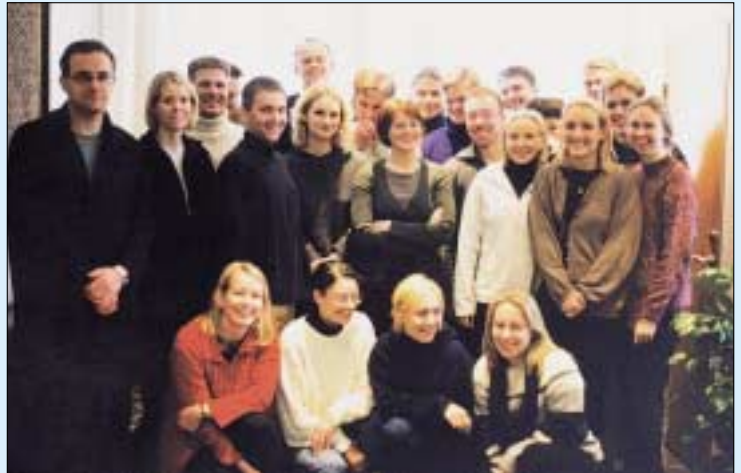
Þátttakendur á fyrsta námskeiði til öflunar beraðsdómsslögmansréttinda.

miðlum. Næg tækifæri eru til að fjalla um dómsmál á vettvangi dómstólanna. Nú og svara fyrirspurnum fjölmiðla um málið eftir að dómsmálið er „fætt“. Við þær aðstæður er báðum málsaðilum tækt að koma sjónarmiðum sínum á framfæri varðandi sakarefni málsins. Slík framgangna hlýtur að vera í anda góðra lögmannshátta sem um er fjallað í I. hluta siðareglanna.