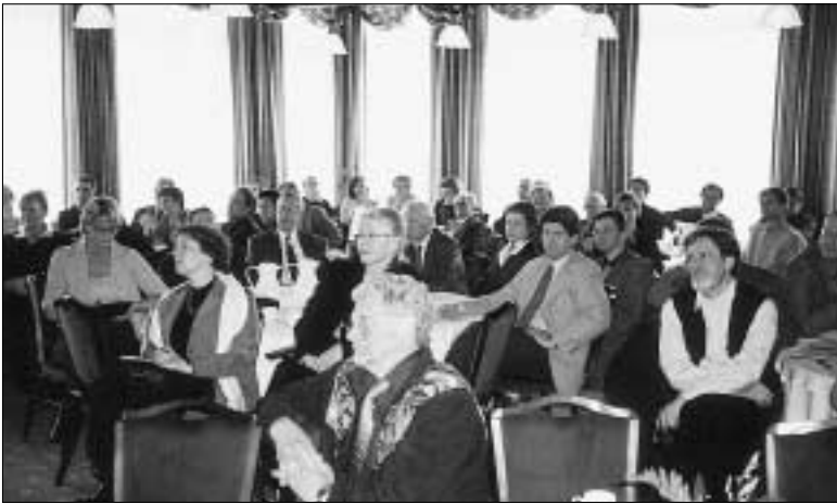
Þátttakendur voru nálægt 100 talsins.

Þau gögn sem inn í grunninn færu, væru ópersónugreinanleg, yrði ekki önnur leið fær en að gefa þeim sem gefa upplýsingar í grunninn, þ.e. sjúklingum í heilbrigðiskerfinu, tækifæri til að taka sjálfir afstöðu til þessarar áhættu með því að spyrja þá fyrirfram. Vardandi mögulegar sáttir í þeim deilum sem verið hafa um lögin