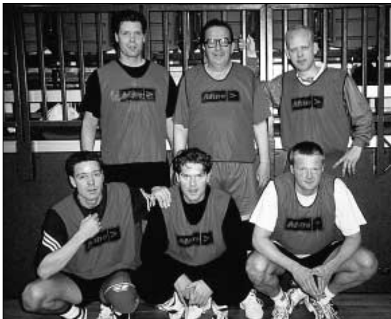
Fullskipað lið Reynslu og Léttleika. Tilbúnir í slaginn.