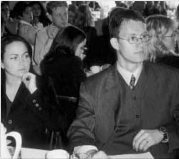
Þáttakendur fylgjast með umræðum.