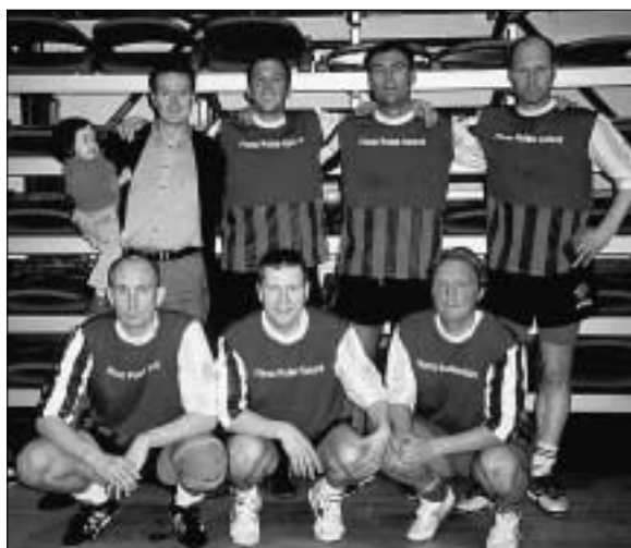
Grínarafélagið ásamt þjálfara og ungum aðdáanda.