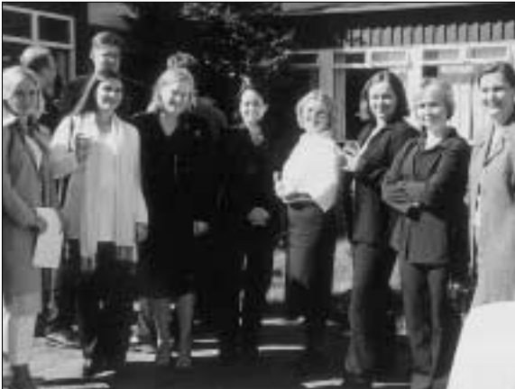
Glæsilegir fulltrúar kvenna úr lögfræðingastétt í veðurbliðunni á Þingvöllum.