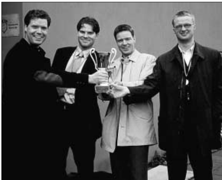
Sígurliðið Reynsla og Léttleiki tekur á móti bikarnum. Á myndina vantar bluta liðsmanna sem urðu frá að hverfa áður en verðlaunaafbending fór fram.

----- Sannaðist hér hið fornkveðna að vont er að liggja sparkandi, en betra að sparka í liggjandi. -----