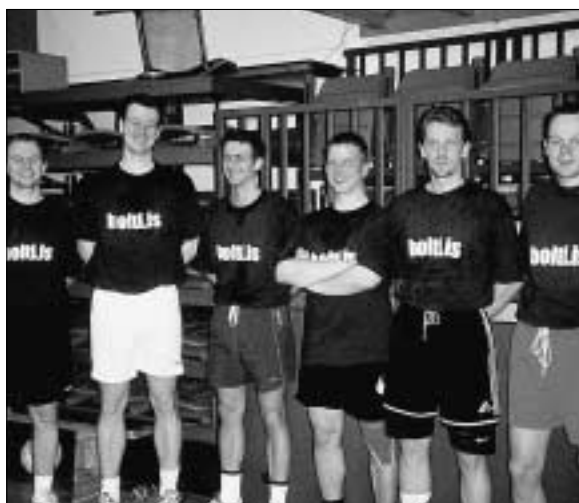
Bolti.is breppti annað sætið.